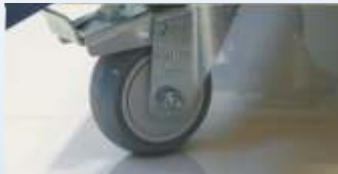
Rodas com trava