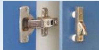
Dobradiças e travas