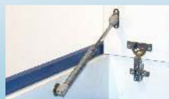
Amortecedor a gás