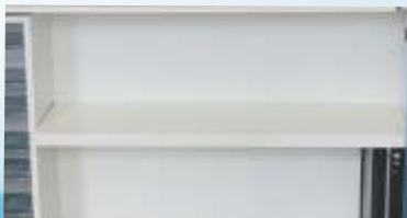
Prateleiras para Livros