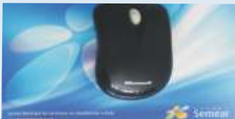
Mouse sem fio