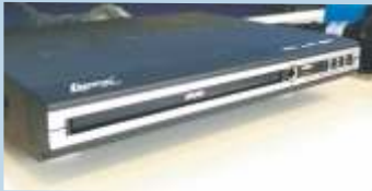
Aparelho de DVD