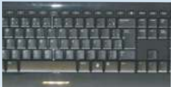
Teclado sem fio